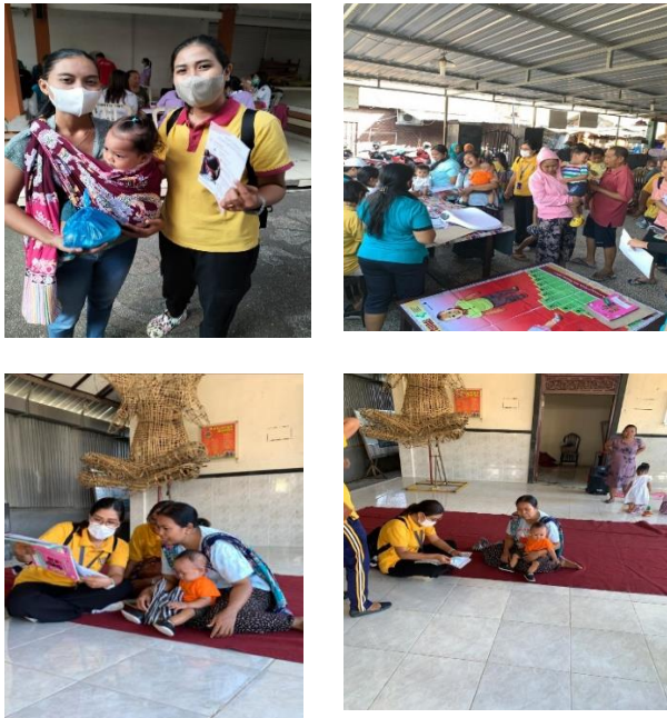
Gambar 4. Dokumentasi Kegiatan