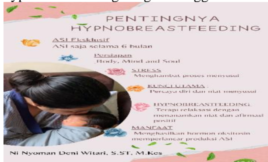
Gambar 2 : Pentingnya Hypnobreastfeeding

Pembekalan dilaksanakan untuk memberikan pemahaman kepada mahasiswa tentang kegiatan yang akan dilakukan, serta pembagian tugas untuk melakukan pengukuran tekanan darah, anamnesa, mengukur kecemasan dengan kuesioner Zung Self-rating Anxiety Scale (ZSAS), memberikan informasi manfaat Hypnobreastfeeding serta pendampingan pelaksanaan langkah-langkah melakukan hypnobreastfeeding dengan menggunakan video