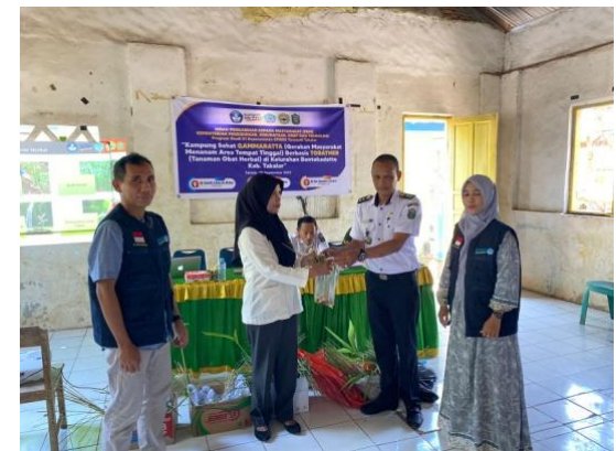
Gambar 2. Pemberian Bibit Tanaman Herbal

Adapun tujuan dari pengabdian ini adalah memberikan dan menambah pengetahuan pada masyarakat tentang pemanfaatan tanaman obat secara baik dan benar. Hal ini bertujuan agar masyarakat dapat memanfaatkan tanaman sebagai obat tradisional dengan benar. Apabila masyarakat mampu memanfaatkan tumbuhan obat yang tumbuh pada pekarangan rumah mereka dengan baik, maka akan sangat membantu masyarakat, baik secara ekonomi maupun kesehatan.