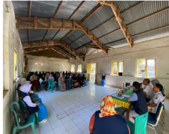
Gambar 1. Pemberian Penyuluhan