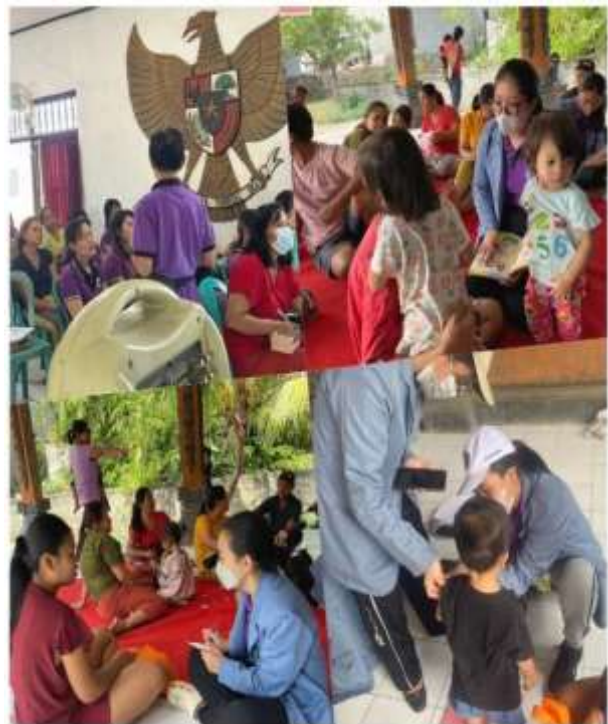
Gambar.2 Pelaksanaan PKM

Sebelum dilaksanakan penyuluhan Pemenuhan gizi balita pada 25 ibu balita di Banjar Dinas Dauh Pura, terlebih dahulu tim menyebar kuesioner. Kuesioner yang diberikan adalah langkah awal untuk mengukur sejauh mana ibu balita mengegetahui dan memahami bagaimana pemenuhan gizi balita yang diketahui ibu. Hasil pre-test ini digunakan sebagai acuan awal dalam membuka sesi diskusi antara pemateri dan audiens, Dimana hasil pre-test menunjukkan bahwa sebagian besar ibu balita kurang dalam pengetahuan gizi balita dan hanya 2 orang yang menunjukkan pengetahuan yang baik. Hasil pre test ini menunjukkan bahwa penting untuk dilakukan penyuluhan mengenai pemenuhan gizi balita pada ibu balita di Banjar Dinas Dauh Pura Desa Wisata Panji.